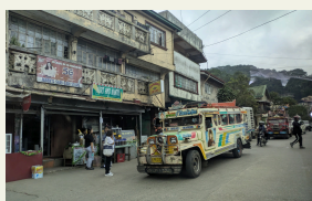
ベンゲット州の街中の雰囲気