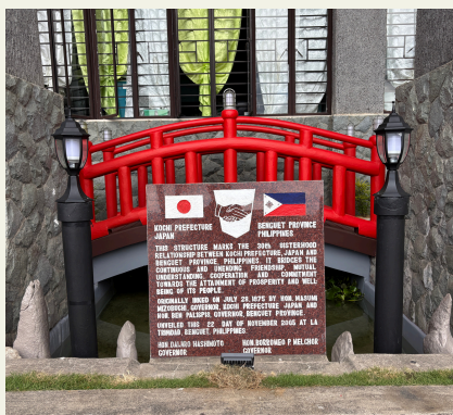
友好提携記念碑（ベンゲット州庁舎内）